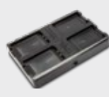
■ 94A150074 4-Fach-Akkuladegerät