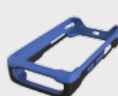
■ 94ACC0132 Gummischutzmantel