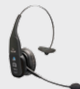
■ 94ACC0127 Bluetooth Headset VX1 B350-XT