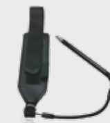
■ 94ACC0133 Handschlaufe (im Lieferumfang dabei)